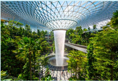
Internationaler Flughafen Changi