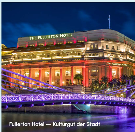
Fullerton Hotel — Kulturgut der Stadt