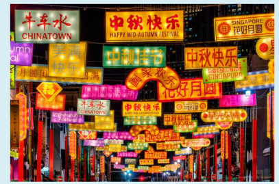
Mittherbstfest in Chinatown

Unser Kulturexperte und Tourguide Terri Chua rät dazu, Erkundungstouren durch Singapur in Chinatown zu beginnen. „Hier können Ihre Gäste in das lebendige Treiben traditioneller Märkte eintauchen, beeindruckende Tempel aufsuchen und natürlich authentisches chinesisches Essen kosten.“ Gleich einer kleinen Weltreise geht die persönliche Stadtführung von Terri nun weiter nach Little India , einem farbenfrohen Viertel, das mit seinen bunten Straßen, Tempeln und der köstlichen indischen Küche begeistert. „Keinesfalls verpassen dürfen Ihre Gäste Kampong Glam , ein historisches Viertel, das mit der charmanten Haji Lane aufwartet. Diese Straße ist bekannt für farbenfrohe Streetart, ausgefallene Boutiquen, hippe Cafés und ein pulsierendes Nachtleben. Um die Geschichte und Kultur Singapurs zu vertiefen, empfehle ich einen Besuch im Singapore National Museum . Dieses wartet mit faszinierenden Einblicken in die Vergangenheit der Stadt auf.“