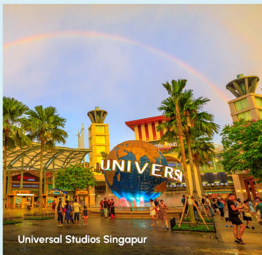
Universal Studios Singapur

Mit seiner fortschrittlichen Infrastruktur und erstklassigen Einrichtungen ist Singapur ideal für Geschäftsreisen, Konferenzen und Veranstaltungen . Die strategische Lage als globaler Knotenpunkt macht die Stadt zudem zu einem wichtigen Stopover-Ziel für Reisende aus aller Welt.