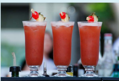
Berühmter Singapore Sling im Raffles Hotel