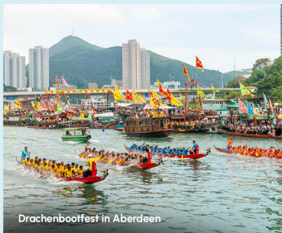
Drachenbootfest in Aberdeen

Empfehlenswert ist auch eine Bootstour zu einer der vorgelagerten Inseln wie Cheung Chau oder Lamma Island. Diese Inseln bieten eine willkommene Abwechslung vom hektischen Stadtleben und sind bekannt für ihre hervorragenden Meeresfrüchte. Der Hongkong Wetland Park ist ein Naturschutz-, Bildungs- und Tourismuszentrum, das die Vielfalt des Ökosystems der Feuchtgebiete Hongkongs eindrucksvoll zeigt. Nicht nur Naturliebhaber kommen hier garantiert auf ihre Kosten!