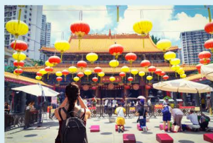
Wong Tai San, ein multi-religiöser Tempel

Ein Besuch der wichtigsten Tempel der Stadt ist für Product Coordinator Winnie Chung ein Muss: „Der Po Lin Tempel in den New Territories, der Man Mo Tempel im Stadtteil Central und der Wong Tai Sin Tempel in Kowloon bieten tiefe Einblicke in die spirituelle Seite Hongkongs. Doch nichts kann den Besuch eines der beeindruckenden Events in Hongkong toppen. Mein absoluter Favorit ist das chinesische Neujahrsfest, wenn die Stadt im Laternenschein rot leuchtet und an jeder Ecke süße Köstlichkeiten dargeboten werden. Und auch das jährliche Drachenbootfest ist etwas ganz Besonderes und einen Besuch wert.“