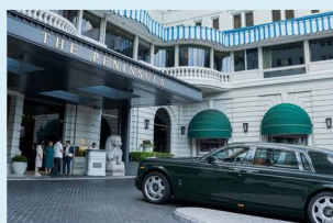
Peninsula Hotel mit typischem Rolls Royce