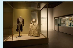
Ausstellungsstück im Hong Kong Palastmuseum