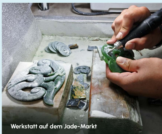
Werkstatt auf dem Jade-Markt