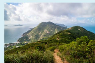
Wanderweg am Dragon’s Back Mountain