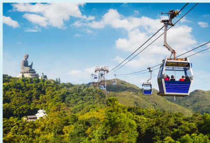
Ngong Ping Gondel mit Rundum-Panoramablick

H ongkong begeistert Reisende aus aller Welt mit seiner einzigartigen Mischung aus Tradition und Moderne. Mit über 1.100 täglichen Flügen aus rund 220 Destinationen weltweit ist die Stadt ein bedeutendes Drehkreuz in Asien. Benachbarte Städte wie Macau sowie bedeutende Metropolen in Festlandchina sind mit dem Hochgeschwindigkeitszug schnell und einfach zu erreichen.